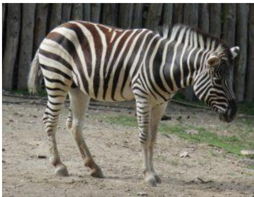
B) zebra damarská - lichokopytník