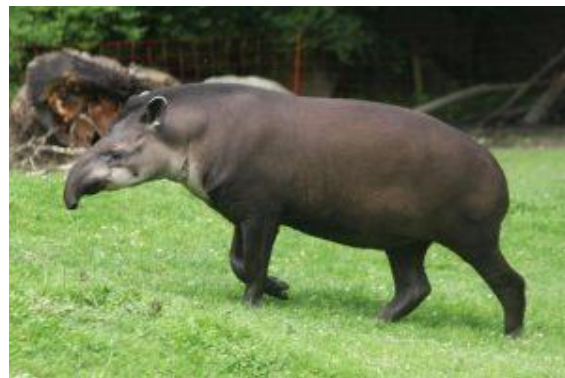
E) tapír jihoamerický- lichokopytník