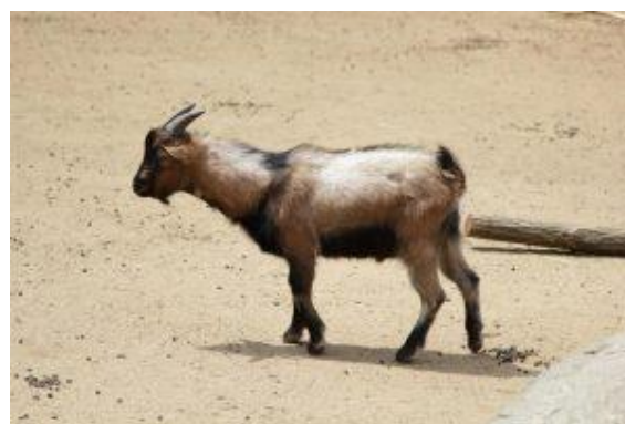
F) koza kamerunská - sudokopytník