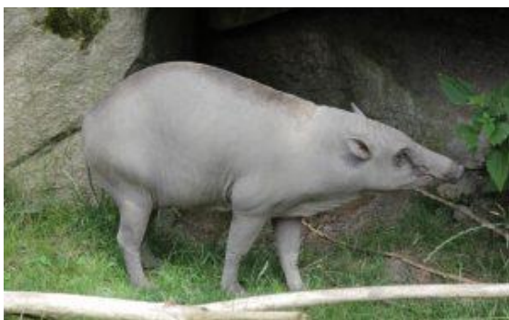
C) babirusa sulaweská - sudokopytník