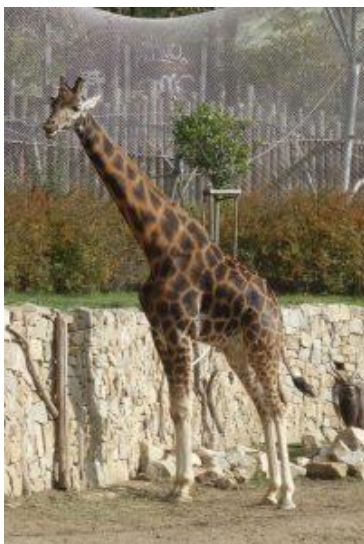
D) žirafa núbijská - sudokopytník